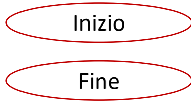
Diagramma di Fusso